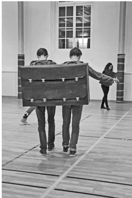
Synchrones, deux artistes, portent la double sacoche où les "lecteurs" vont tour à tour venir choisir des ouvrages dans chacune des deux bibliothèques, pour les lire aux oreilles attentives des spectateurs. (Liste des ouvrages ci-contre)

C'est l'objet du second samedi d'atelier, lors duquel les élèves sont laissés libres d'improviser, d'essayer les chorégraphies, les mouvements de scène et le jeu d'acteur. Habitué à ce fonctionnement dans le cadre de l'atelier de théâtre, les lycéens épatent aussi bien les artistes que les responsables de la biennale présents lors de l'atelier, par leur créativité, leur dynamisme et leur sens du collectif.