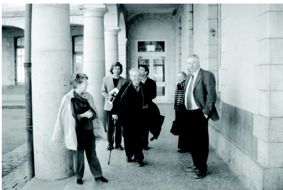
Vers le Petit Lycée