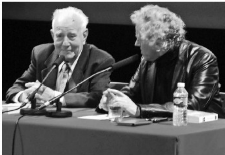
J. Delumeau et P. Ory présentation du livre aux Champs Libres le 15-1-2014

Rappelons que Jean Delumeau a été professeur de Khâgne dans notre établissement. (Voir page ci-contre)